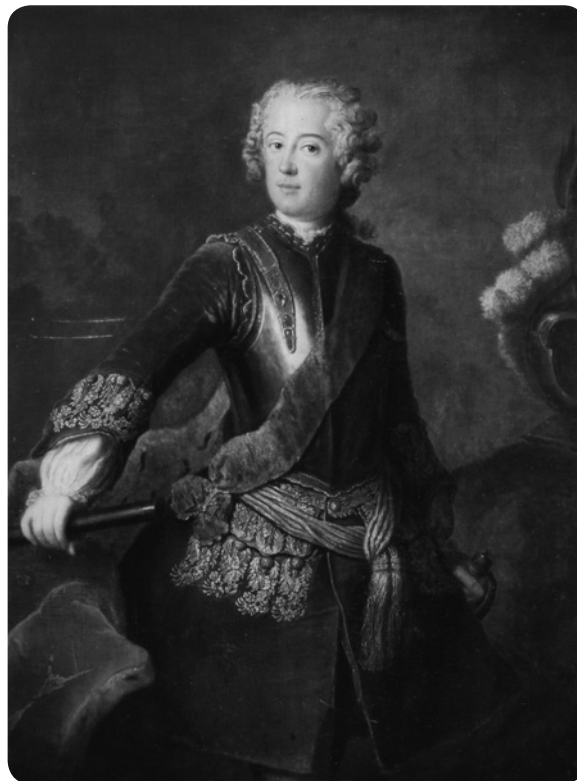
A. Pesne, Federico II de Prusia (c. 1736).